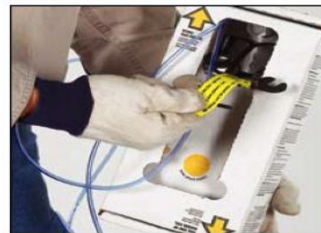
Быстрая и легкая установка